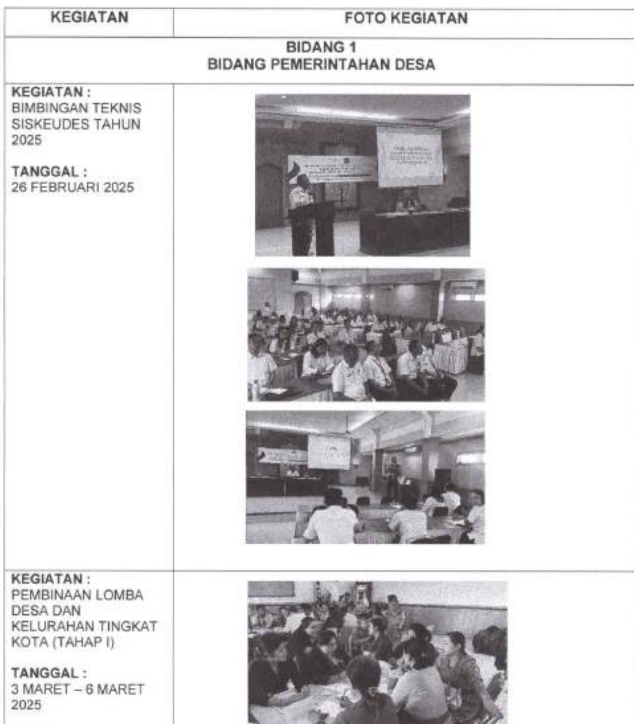
Tabel 3.4 Dokumentasi Pelaksanaan Kegiatan pada Triwulan I TA. 2025